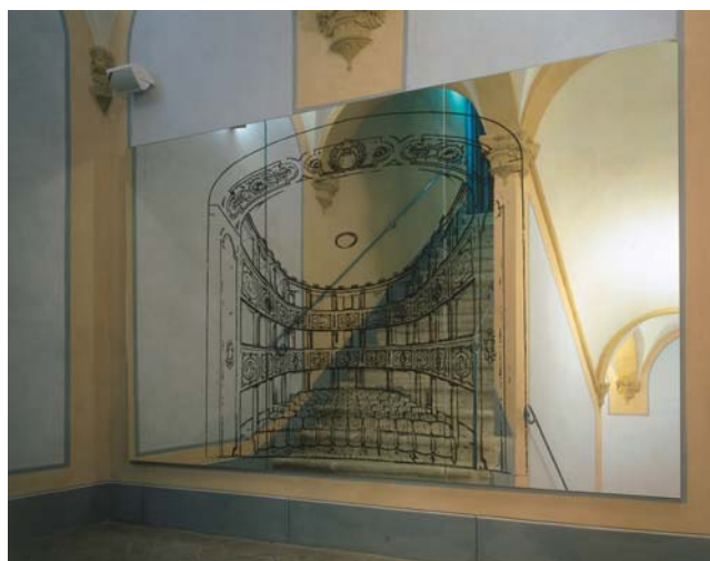
Mario Airò (in collaborazione con Attilio Maranzano) Progetto per il Teatro dei Leggieri, 2002 veduta dell'installazione permanente presso il Teatro dei Leggieri Specchio serigrafato cm. 180x300, 8 fotografie su alluminio Progetto Speciale per Arte all'Arte 7 a San Gimignano