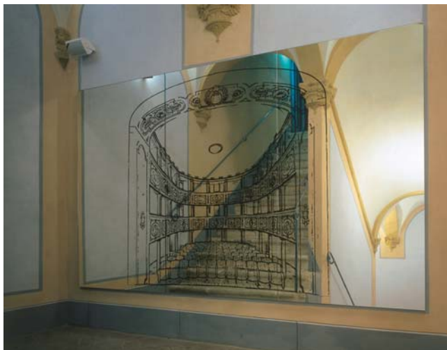
Mario Airò (in collaborazione con Attilio Maranzano) Progetto per il Teatro dei Leggieri, 2002 veduta dell'installazione permanente presso il Teatro dei Leggieri Specchio serigrafato cm. 180x300, 8 fotografie montate su alluminio Progetto Speciale per Arte all'Arte 7 a San Gimignano